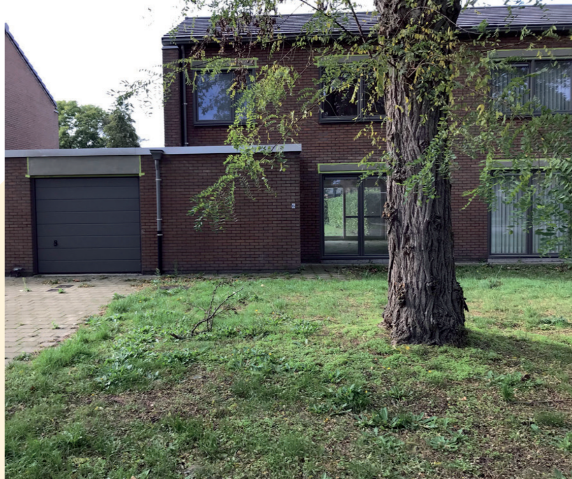
Jozef Cardijnlaan in Oostakker (Gent)

Patrimonium: 58 woningen, 33 woningen, 12 appartementen + 102 woningen