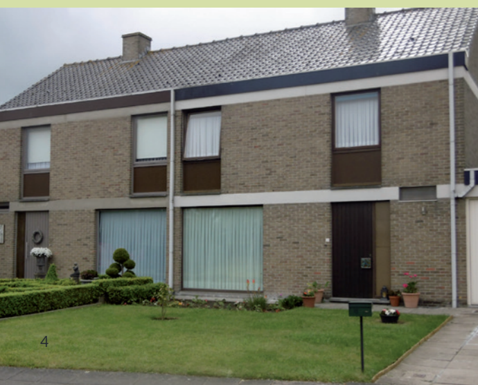
Cardijnlaan in Aalter

Aalter, Evergem en Oostakker zijn niet de enige gemeenten in Vlaanderen, die de man eer bewijzen door een straat naar hem te vernoemen. In Vlaanderen werden maar liefst 107 straten en pleinen naar Jozef Cardijn vernoemd. Die grote aanwezigheid in het straatbeeld moet zo zijn redenen hebben. Die man moet best wel belangrijk zijn. Dat mochten we ook onlangs nog vaststellen bij de voorstelling van de Canon van Vlaanderen . In die Canon wordt aan de hand van zestig 'vensters' kennis gedeeld over wat men zou moeten weten over het Vlaanderen van vandaag. Cardijn is één van die zestig 'vensters' om het verhaal van Vlaanderen te vertellen. Alweer, die man moet best wel belangrijk zijn . Maar waarom dan?